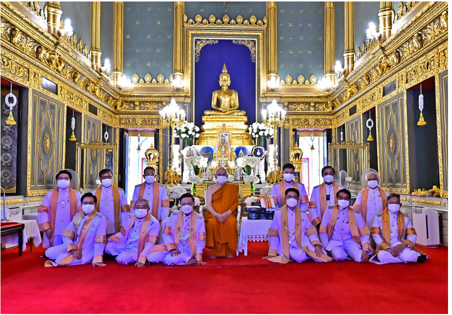
เจ้าพระคุณ สมเด็จพระสังฆราช ประทานพระวโรกาสให้คณะกรรมการสภาและคณะผู้บริหารมหาวิทยาลัย ร่วมถวายพระรูป