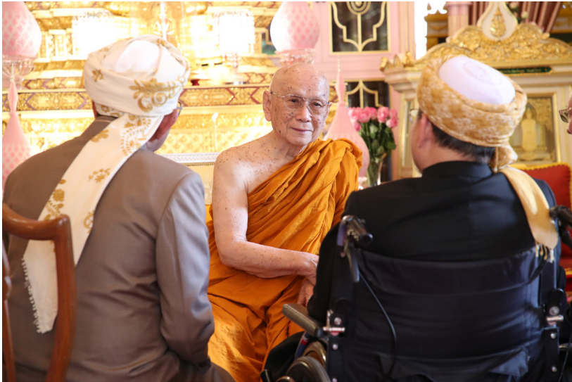
ประธาณพระวโรภาสให้จุฬาราชมนตรีกราบทูลปรึกษาเรื่องการจัดทำแนวทางปฏิบัติของชาวไทยมุสลิม