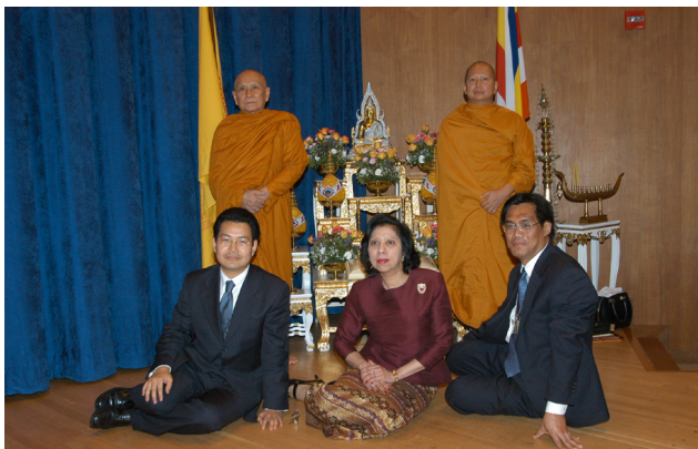
ทรงเป็นผู้นำแทนมหาเถรสมาคมกล่าวพระสัมโมทนียกถาในงานวันวิสาขบูชา วันสำคัญสากลของสหประชาชาติ International Recognition of the Day of Vesak ณ สำนักงานใหญ่สหประชาชาติ นครนิวยอร์ก ประเทศสหรัฐอเมริกา