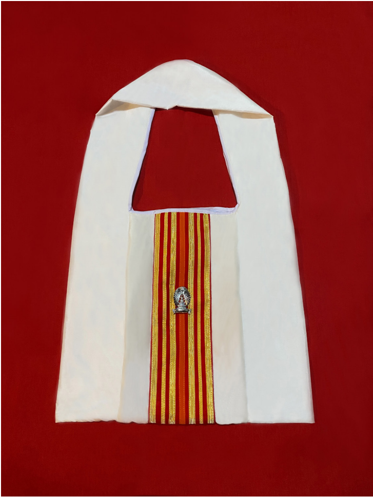
ย่ามแสดงพระวิทยฐานะที่จุฬาลงกรณ์มหาวิทยาลัยทูลถวายเป็นกรณีพิเศษ