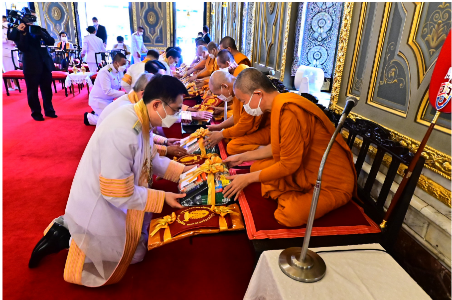
อธิการบดีและผู้บริหารมหาวิทยาลัยถวายเครื่องไทยธรรม แต่พระสงฆ์ที่เจริญชัยมงคลคาถา