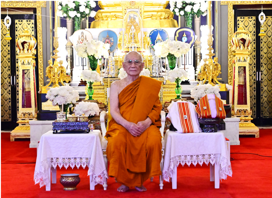
เจ้าพระคุณ สมเด็จพระสังฆราช ฉายพระรูปในพระอุโบสถ วัดราชบพิธสถิตมหาสีมาราม ในโอกาสที่จุฬาลงกรณ์มหาวิทยาลัยเฟื่องลวดวายปริญญาครุศาสตรดุษฎีบัณฑิตกิตติมศักดิ์