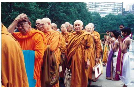
ทรงร่วมประชุมสุดยอดผู้นำทางศาสนาและจิตวิญญาณเพื่อสันติภาพของโลก ณ องค์การสหประชาชาติ นครนิวยอร์ก ประเทศสหรัฐอเมริกา วันที่ ๒๑ - ๓๑ สิงหาคม ๒๕๔๓