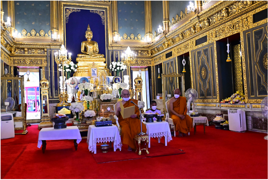
เจ้าพระคุณ สมเด็จพระสังฆราชประทานพระดำรัส