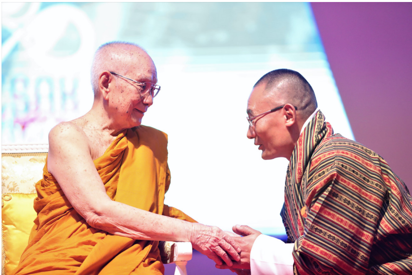
เสด็จไปทรงเปิดการประชุมชาวพุทธนานาชาติ เนื่องในเทศกาลวิสาขบูชา วันสำคัญสากลของโลก ประจำพุทธศักราช ๒๕๖๑ ณ มหาวิทยาลัยมหาจุฬาลงกรณราชวิทยาลัย