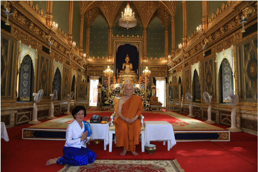
ทรงรับสมเด็จพระราชบุตรี อนุชนโรดม อรุณรัศมี พระชนนีษฐกคินีและอุดมที่ปรึกษาในพระบาทสมเด็จพระบรมนาถนโรดม สีหนุ แห่งราชอาณาจักรกัมพูชา