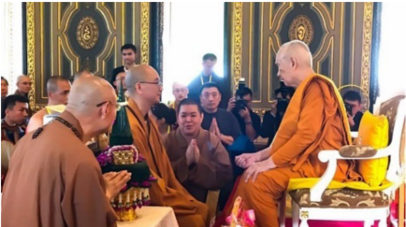
ประธานพระวโรกาสให้ พระเสวียเฉิง ประธานพุทธสมาคมแห่งสาธารณรัฐประชาชนจีน และผู้นำทางพระพุทธศาสนาจากประเทศจีน เผ่าถวายสักการะ