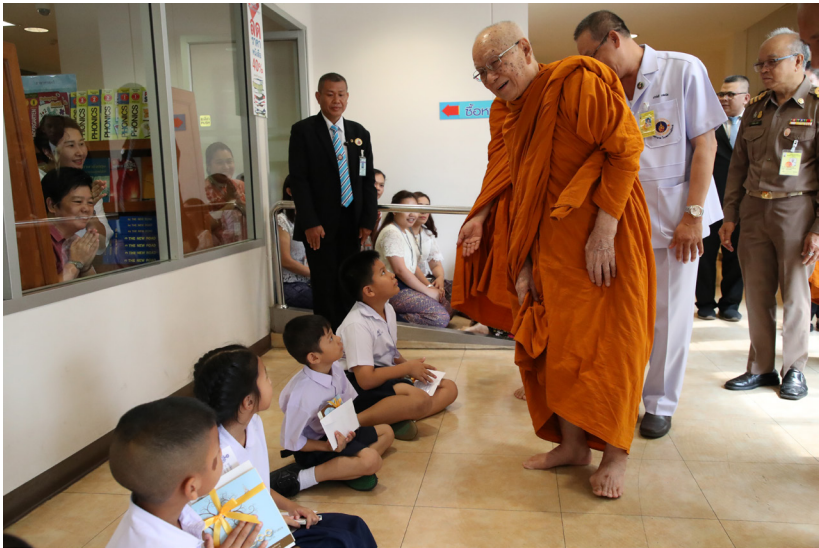
ประธานทุนการศึกษาในฐานะนายกรัฐมนตรีบริหารมูลนิธิมหามกุฏราชวิทยาลัย ในพระบรมราชูปถัมภ์