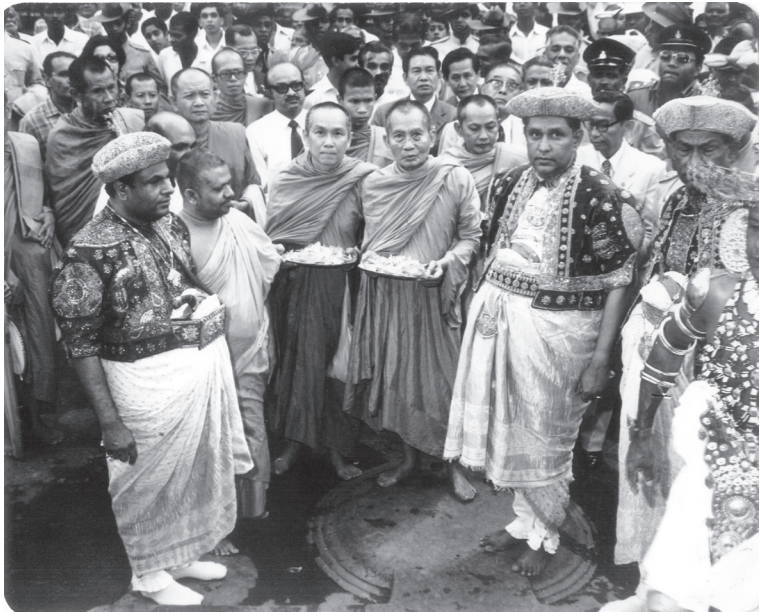
ทรงเป็นลำ่าประจำพระองค์ในเจ้าพระคุณ สมเด็จพระสังฆราชเจ้า กรมหลวงชินวราลงกรณ ในโอกาสที่ทรงเสด็จไปทรงแสดงธรรมหรือเสด็จไปปฏิบัติพระศาสนกิจ ณ ประเทศต่าง ๆ