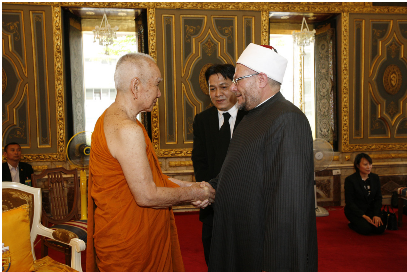
ประธาณพระวโรภาสให้ ศาสตราจารย์ ดร.เชาว์กี อิบราฮิม อับเดลการิม โมซา อัลแลม ผู้ตัดสินชี้ขาดสูงสุดทางศาสนาอิสลาม (Grand Mufti) สาธารณรัฐอาหรับอียิปต์ เฝ้าถวายสักการะ