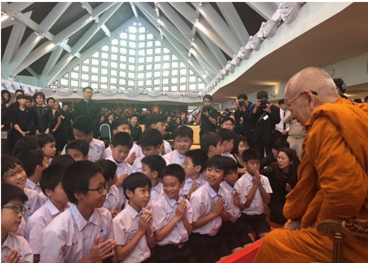
ประทานพระวโรกาสให้นักเรียนโรงเรียนสาธิตจุฬาลงกรณ์มหาวิทยาลัย เฝ้าถวายสักการะ