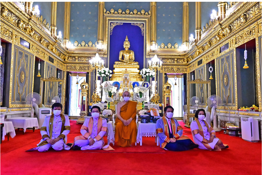
เจ้าพระคุณ สมเด็จพระสังฆราช ประทานพระวโรกาสให้คณะผู้เรียบเรียงหนังสือกิตตินิรมลคุณฐานันยบัณฑิต ร่วมถวายพระรูป