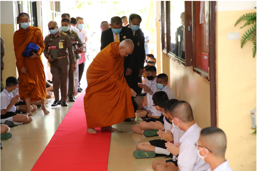
ทรงเป็นองค์อุปถัมภ์โรงเรียนวัดราชบพิศ ตั้งแต่ พ.ศ.๒๕๑๔ - ปัจจุบัน