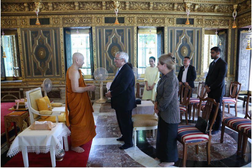
ประธานพระวโรกาสให้นายเมธีร์ ชโลโม เอกอัครราชทูตอิสราเอลประจำประเทศไทย เฝ้าถวายคำนำ