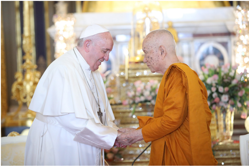
ทรงรับสมเด็จพระสันตะปาปาฟรานซิสในโอกาสเสด็จเยือนประเทศไทยอย่างเป็นทางการ