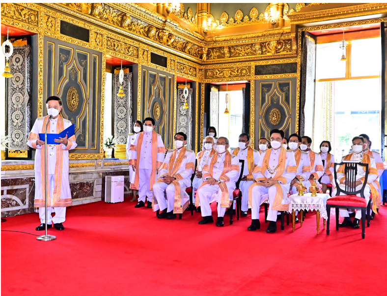
นายสภาจุฬาลงกรณ์มหาวิทยาลัยกราบทูลสำนักในพระกรุณาธิคุณ