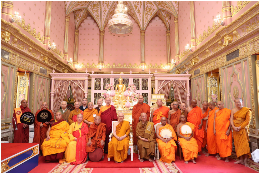
ทรงรับประมุขสงฆ์ และประธานพระวโรกาสให้รัฐมนตรีกระทรวงวัฒนธรรม รัฐมนตรีว่าการกระทรวงศาสนา และผู้แทนระดับสูงจากนานาประเทศ เผื่อถวายสักการะ ในโอกาสที่กรมการศาสนา กระทรวงวัฒนธรรม อาหาราและเชิญมางานสวดมนต์ข้ามปี พ.ศ. ๒๕๖๒