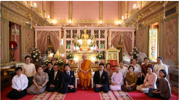
ประธานพระไตรปิฎกฉบับภาษาเขมรเป็นหนังสือค้นคว้าอ้างอิงแก่หอพระไตรปิฎกนานาชาติ คณะอักษรศาสตร์ จุฬาลงกรณ์มหาวิทยาลัย