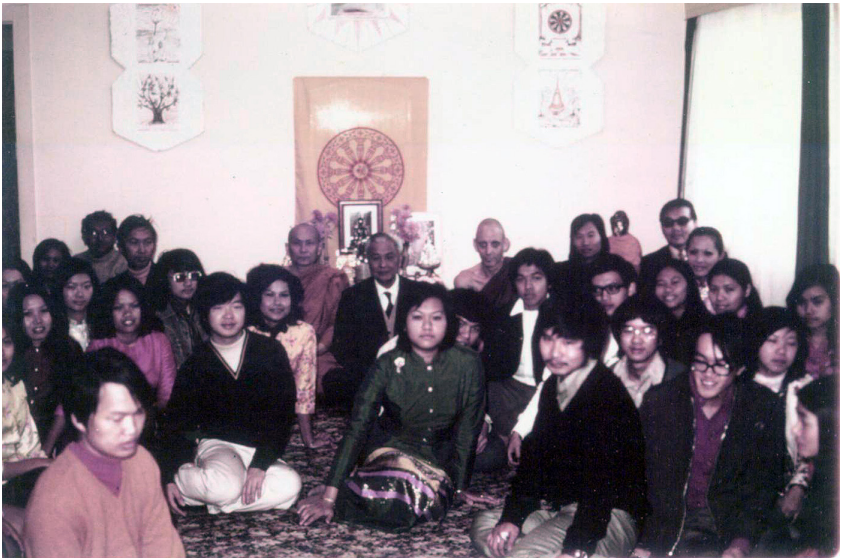
ทรงเป็นพระธรรมทูตนำพระพุทธศาสนาฝ่ายเถรวาทไปเผยแผ่ ณ ประเทศออสเตรเลีย เป็นครั้งแรก