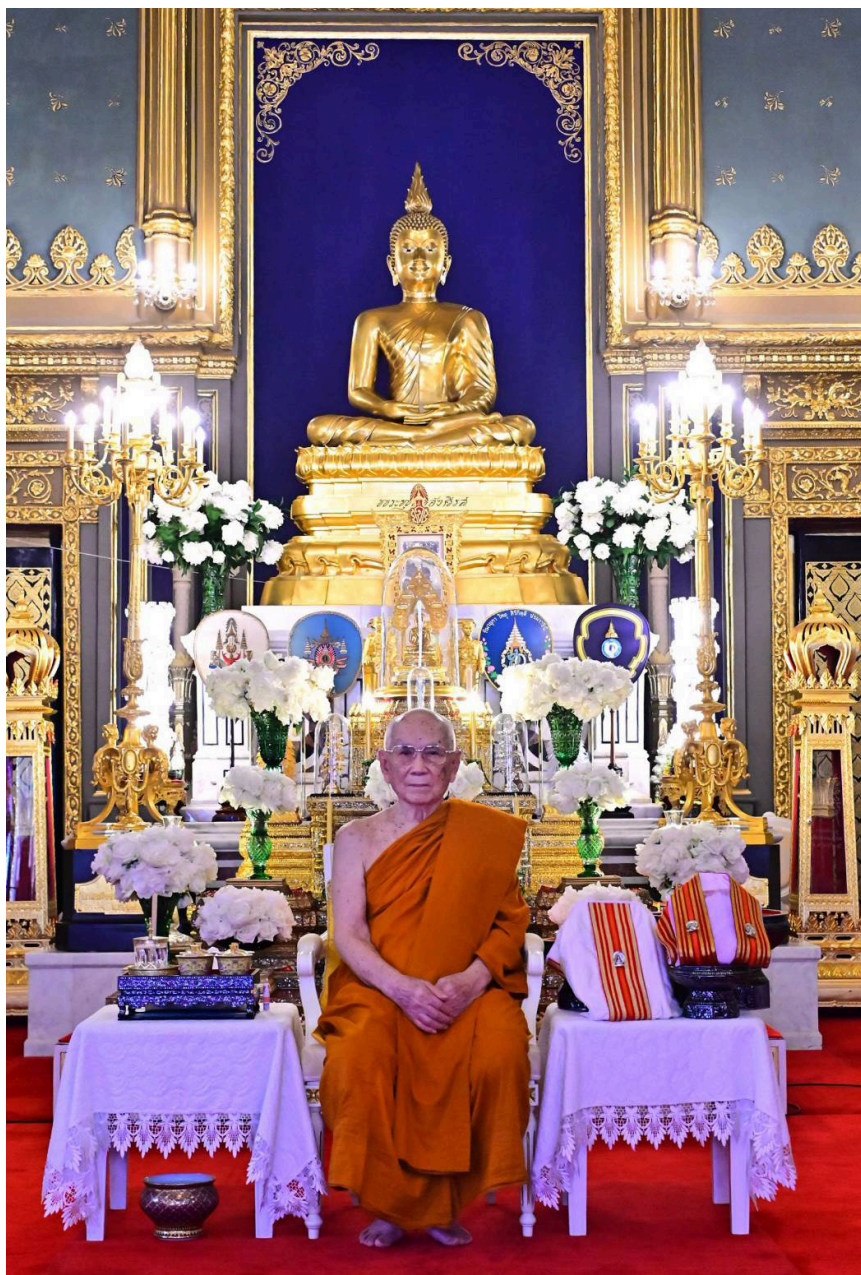
เจ้าพระคุณ สมเด็จพระอริยวงศาคตญาณ (อมฺพรมหาเถร) สมเด็จพระสังฆราช สกลมหาสังฆปริณายก ครูศาสตรคุณฐิบัณฑิตกิตติมศักดิ์แห่งจุฬาลงกรณ์มหาวิทยาลัย