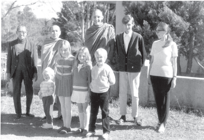
ทรงเป็นพระธรรมทูตนำพระพุทธศาสนาฝ่ายเถรวาทไปเผยแผ่ ณ ประเทศออสเตรเลีย เป็นครั้งแรก