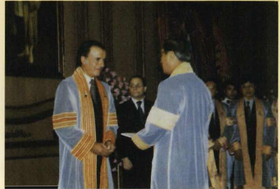
พิธีประสาทปริญญาศิลปศาสตรดุษฎีบัณฑิตกิตติมศักดิ์แก่ ฯพณฯ ดร.การ์โลส ซาอูล เมเนม ประธานาธิบดีสาธารณรัฐอาร์เจนตินา