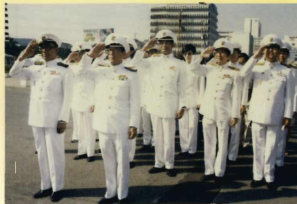
พิธีถวายสักการะพระบาทสมเด็จพระมงกุฎเกล้าเจ้าอยู่หัว