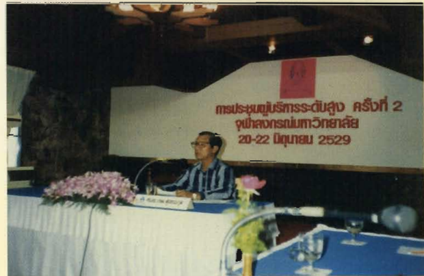
ประชุมผู้บริหารระดับสูง