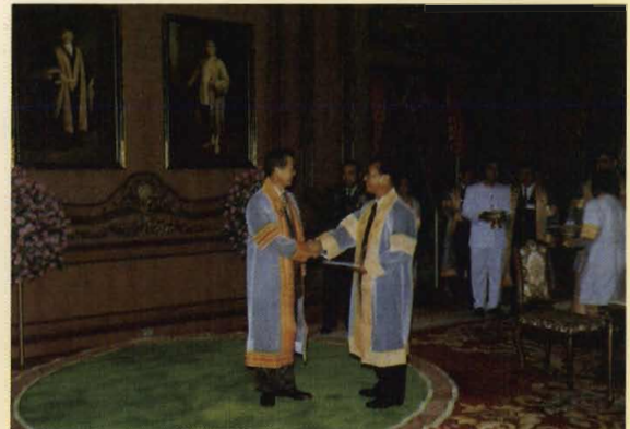
พิธีประสาทปริญญาศิลปศาสตรดุษฎีบัณฑิตกิตติมศักดิ์แก่ ฯพณฯ นายอัลเบร์โต ฟุจิมิรี ประธานาธิบดีสาธารณรัฐเปรู