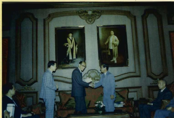
ต้อนรับอธิการบดีมหาวิทยาลัยบักกิง