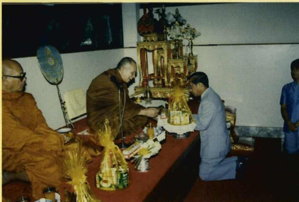
ถวายผ้าป่าสร้างตึก ภปร.