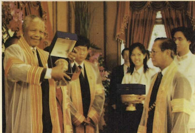
พิธีประสาทปริญญาศิลปศาสตรดุษฎีบัณฑิตกิตติมศักดิ์แก่ ฯพณฯ นายเนลสัน แมนเดลา ประธานาธิบดีสาธารณรัฐแอฟริกาใต้