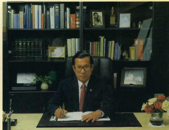
ที่ห้องทำงานอธิการบดีและนายกสภาจุฬาลงกรณ์มหาวิทยาลัย