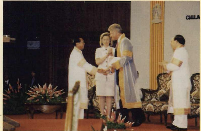
พิธีประสาทปริญญาเศรษฐศาสตรดุษฎีบัณฑิตกิตติมศักดิ์แก่ ฯพณฯ นายบิล คลินตัน ประธานาธิบดีสหรัฐอเมริกา