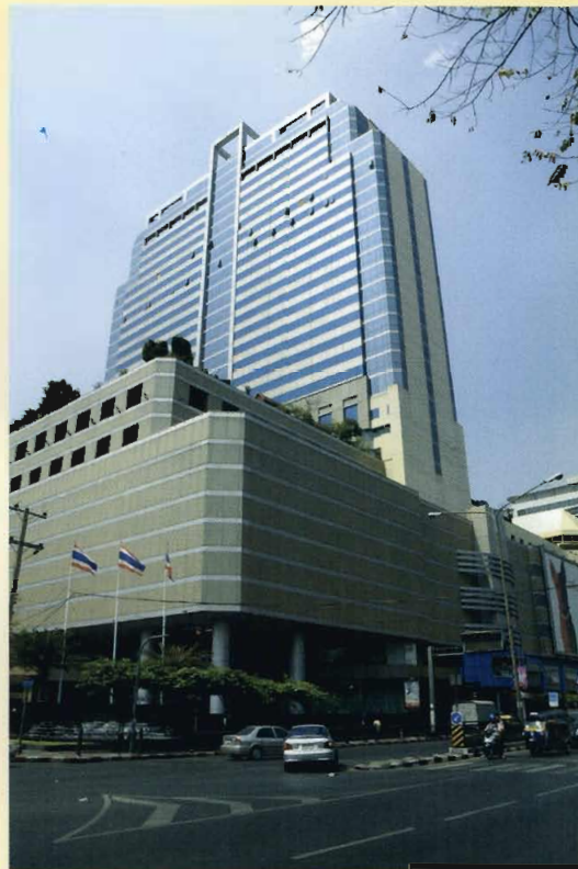
ศูนย์การค้ามาบุญครอง