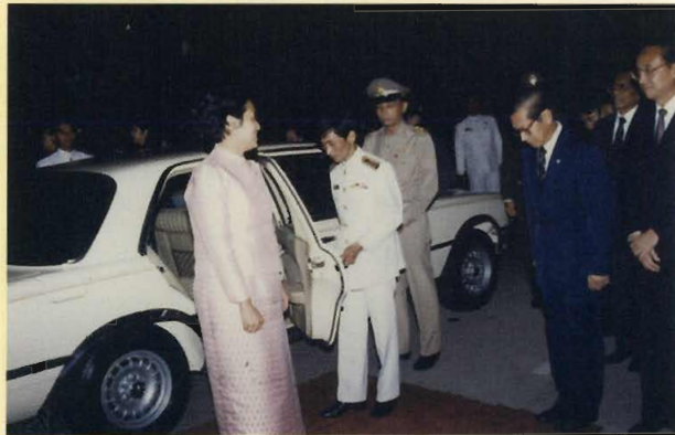
สมเด็จพระเทพรัตนราชสุดาฯ สยามบรมราชกุมารี เสด็จพระราชดำเนินทรงดนตรีไทยปี่พาทย์ดึกดำบรรพ์