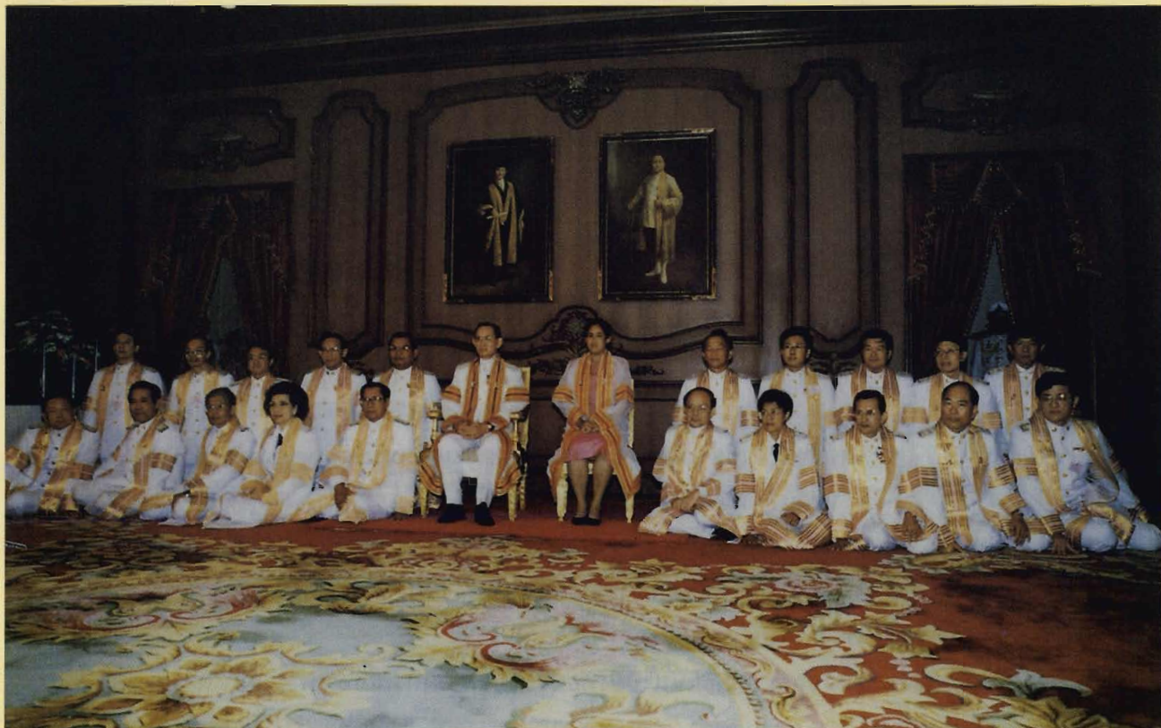
จุฬาลงกรณ์มหาวิทยาลัยทูลเกล้าฯ ถวายปริญญาศิลปกรรมศาสตรดุษฎีบัณฑิตกิตติมศักดิ์แด่ สมเด็จพระเทพรัตนราชสุดาฯ สยามบรมราชกุมารี ในวาระ ๕๐ ปีแห่งการสถาปนามหาวิทยาลัย