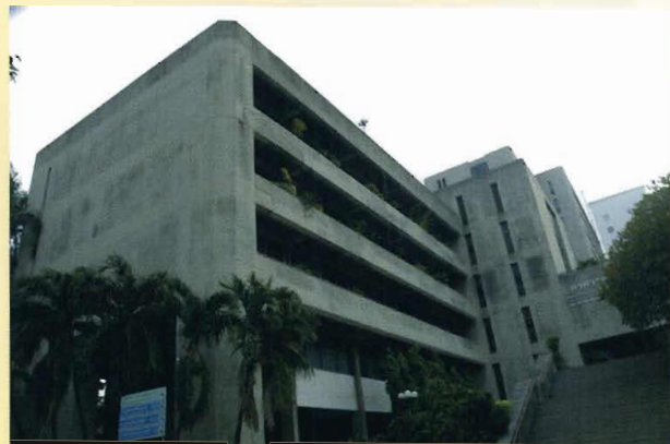
ศูนย์เครื่องมือวิจัยทางวิทยาศาสตร์และเทคโนโลยี