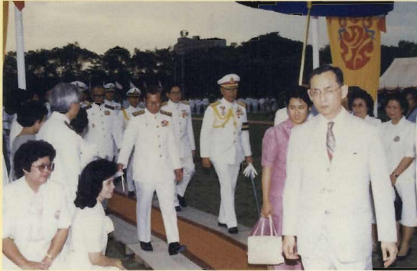
พระบาทสมเด็จพระเจ้าอยู่หัว และสมเด็จพระเทพรัตนราชสุดาฯ สยามบรมราชกุมารี เสด็จพระราชดำเนินทรงเปิดพระบรมราชานุสาวรีย์สมเด็จพระปิยมหาราชและสมเด็จพระมหาธีรราชเจ้า และทรงเปิดงานจุฬาฯ วิชาการ