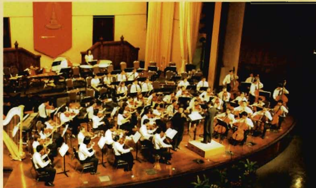
วงซิมโฟนีอออร์เคสตรา