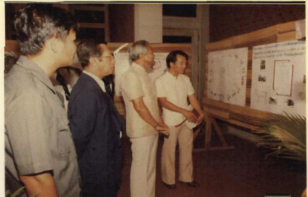
ฯพณฯ พลเอกเปรม ติณสูลานนท์ เปิดนิทรรศการการวิจัย เพื่อพัฒนาชนบท