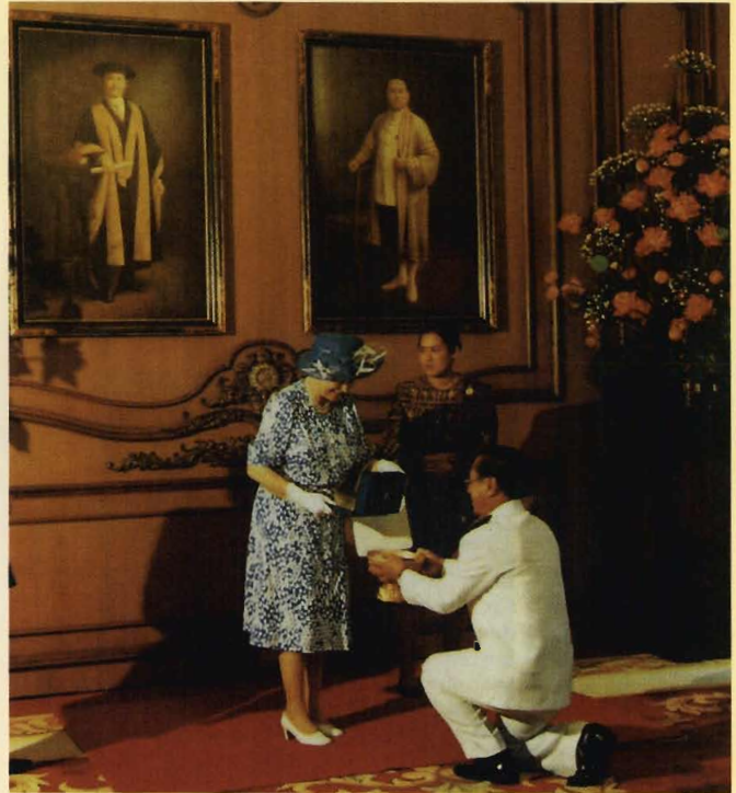
สมเด็จพระราชินีนาถเอลิซาเบธที่ ๒ เสด็จฯ เยือนจุฬาลงกรณ์มหาวิทยาลัย ครั้งที่ ๒