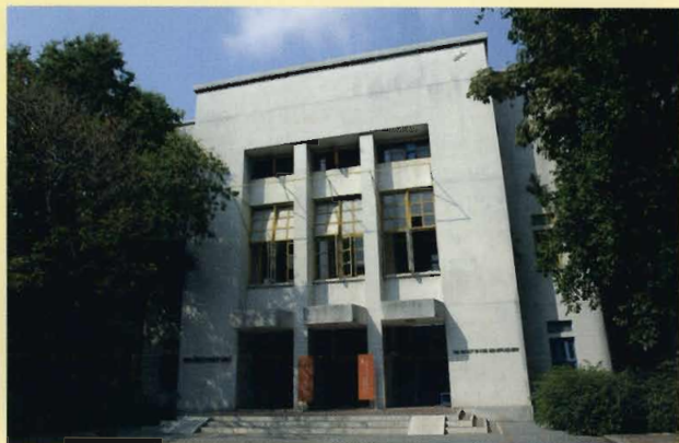
คณะศิลปกรรมศาสตร์