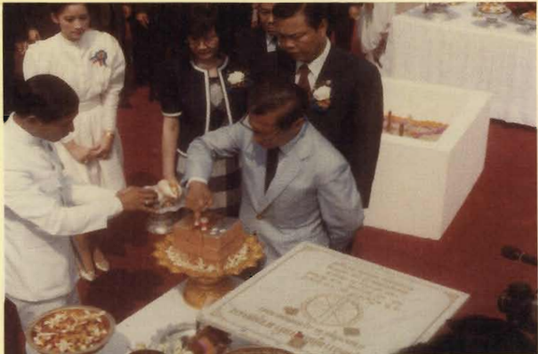
วางศิลาฤกษ์อาคารมาบุญครอง