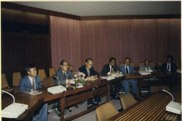
ประชุมผู้บริหารมหาวิทยาลัย