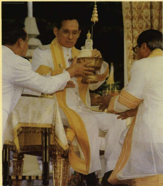
จุฬาลงกรณ์มหาวิทยาลัยทูลเกล้าฯ ถวายพระพุทธรูป ปฏิมาแก้วผลึกแด่พระบาทสมเด็จพระเจ้าอยู่หัวเนื่องใน มงคลวโรกาสที่พระบาทสมเด็จพระเจ้าอยู่หัว ทรงครองสิริ ราชสมบัติ เป็นปีที่ ๕๐