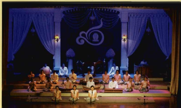
วงดนตรีไทยปี่พาทย์ดึกดำบรรพ์