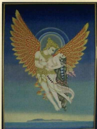
โครงการรวบรวมผลงานศิลปกรรม