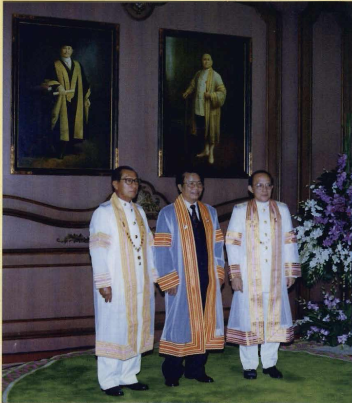
พิธีประสาทปริญญาศิลปศาสตรดุษฎีบัณฑิตกิตติมศักดิ์แก่ ฯพณฯ นายตรีน ตี๊ก เลือง ประธานาธิบดีสาธารณรัฐสังคมนิยมเวียดนาม