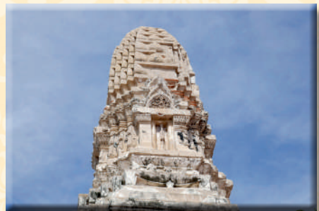
ภาพที่ ๑๗ รายละเอียดส่วนยอดของพระปรางค์