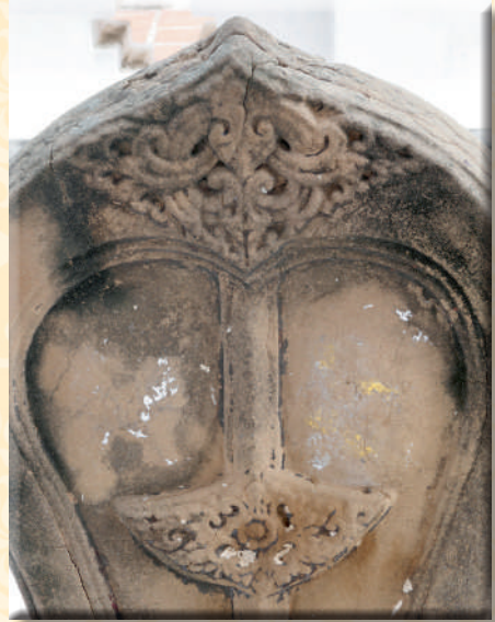
ภาพที่ ๑๔ ลวดลายสลักโบสถ์