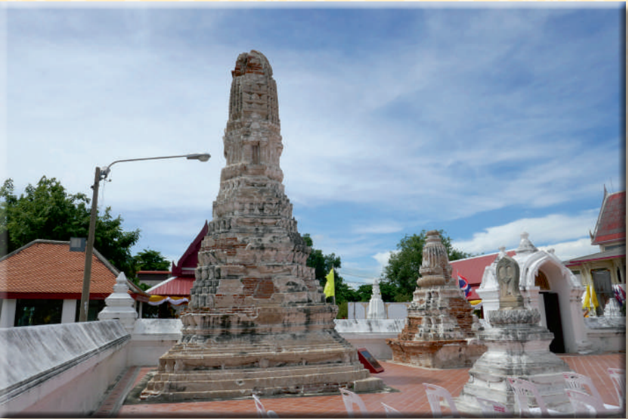
ภาพที่ ๑๘ เจดีย์รายทรงพระปรางค์ย่อมไม้ ๒๐ และเจดีย์รายทรงเครื่อง