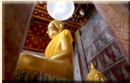
ภาพที่ ๑๑ จิตรกรรมพุทธประวัติตอนเสด็จโปรดพระพุทธรามารดาบนสวรรค์ชั้นดาวดึงส์