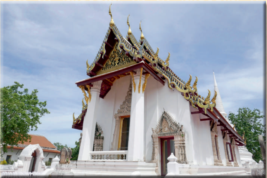
ภาพที่ ๒ พระอุโบสถวัดศาลาปูนวรวิหาร