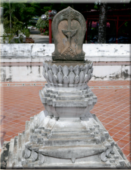
ภาพที่ ๑๓ โบสถ์และส่วนฐาน