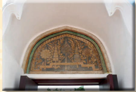
ภาพที่ ๔ ลายปูนปั้นรูปทศสมเด็จพะพุฒาจารย์