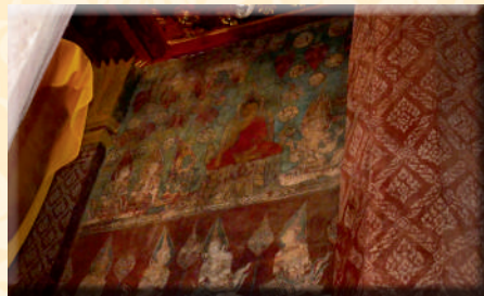
ภาพที่ ๑๒ รายละเอียดภาพพุทธประวัติตอนเสด็จโปรดพระพุทธรามารดาบนสวรรค์ชั้นดาวดึงส์