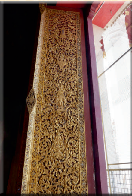
ภาพที่ ๑๐ บานประตูกลาง