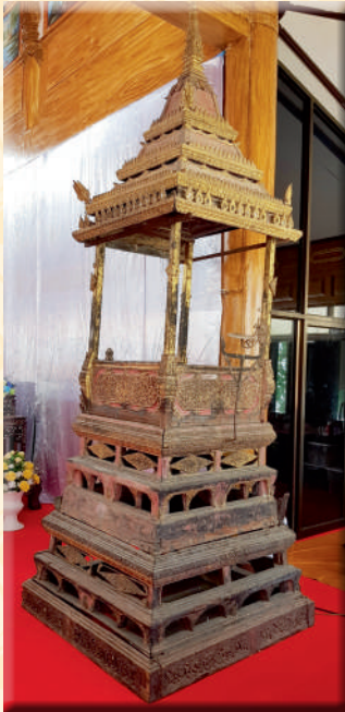
ภาพที่ ๒๑ ธรรมาสณีไม้แกะสลักวัดศาลาปูน