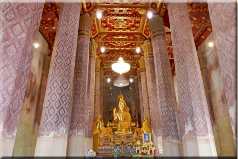
ภาพที่ ๘ ภายในพระอุโบสถ