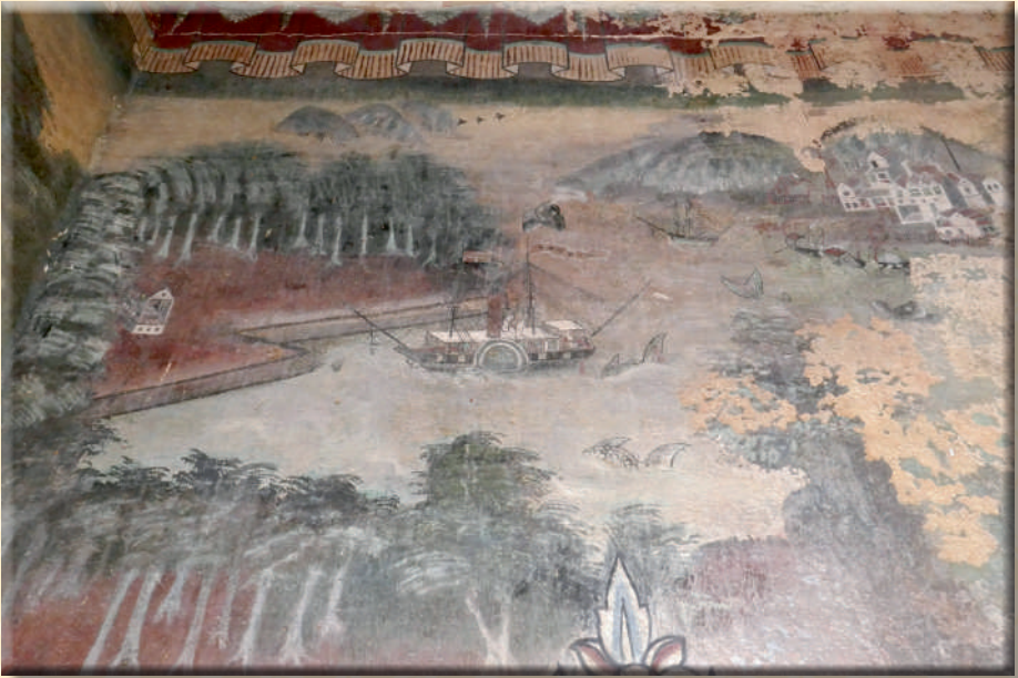
ภาพที่ ๗ ภาพทิวทัศน์และเรือกลไฟประดับธงราชอาณาจักรเดนมาร์ก