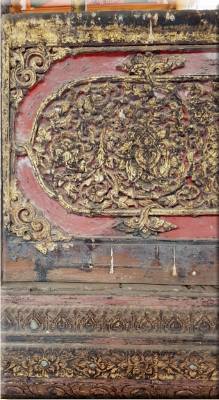
ภาพที่ ๒๓ ลายค้างคาวประดับมุมและลายก้านขดพันธุ์พฤกษาแกะสลักเป็นช่อดอกโบตัน