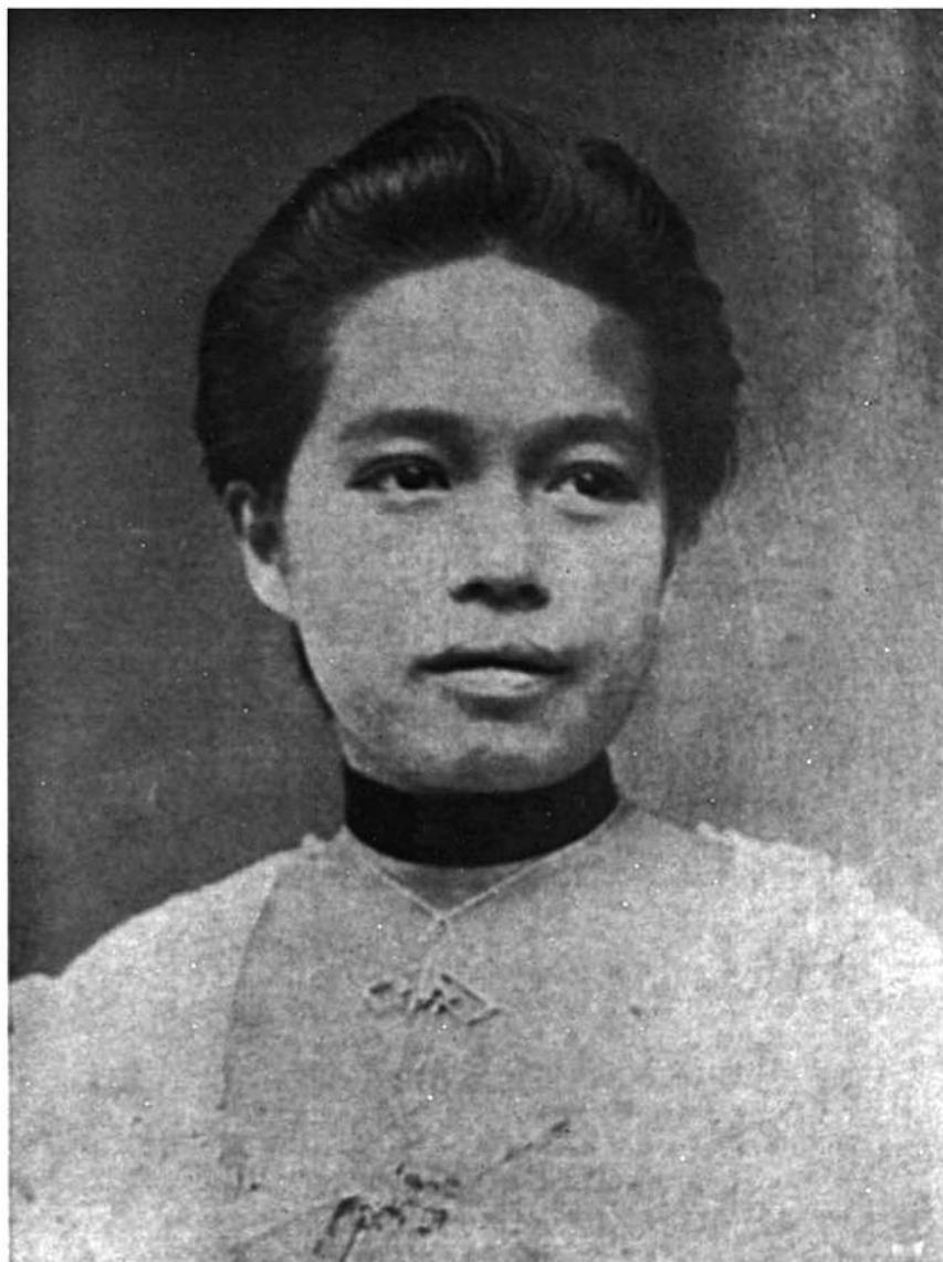
หม่อมเจ้าหญิงพร้อมเพราพรรณ ก จ.