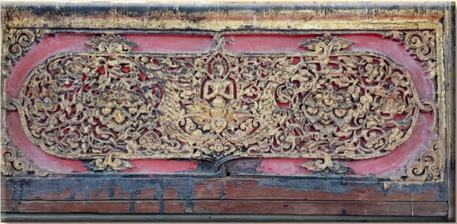
ภาพที่ ๒๒ รายละเอียดดุนักรรมาสน์รูปเทพพนมประกอบลายหงส์และลายก้านขดพันธุ์พฤกษา