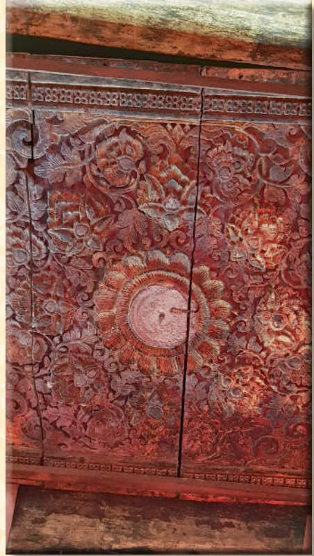
ภาพที่ ๒๔ ดาวเพดานจำหลักลายดอกบัวประกอบลายก้านขดและดอกโบตัน