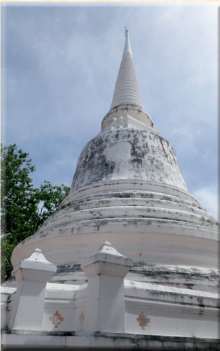
ภาพที่ ๑๕ พระเจดีย์ประธานทรงระฆัง