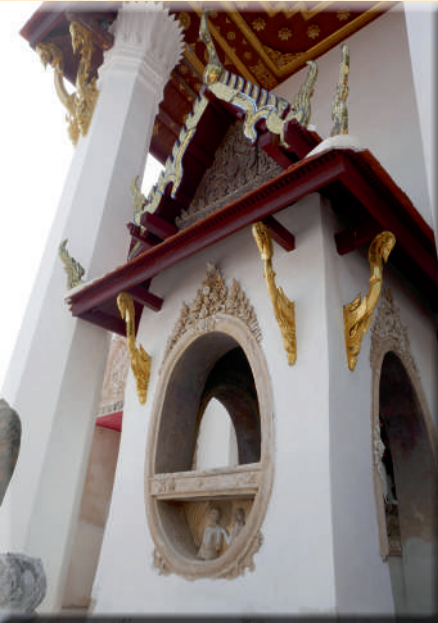
ภาพที่ ๕ มณฑปเรือนยอดด้านหลังพระอุโบสถ