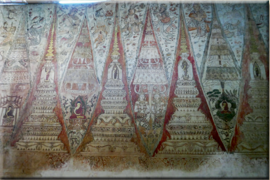
ภาพที่ ๑๙ ภาพจิตรกรรมเจดีย์ทรงเครื่องวัดเกาะแก้วสุทธาราม จังหวัดเพชรบุรี พ.ศ. ๒๒๗๗