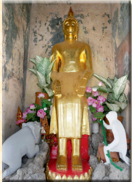
ภาพที่ ๖ พระพุทธปฏิมาปางปาไลโยภัก