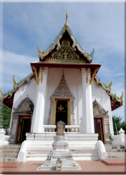
ภาพที่ ๓ หน้าบันและซุ้มประตูทางเข้าพระอุโบสถ