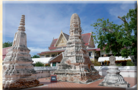
ภาพที่ ๑๖ เจดีย์รายทรงเครื่องย่อมุมไม้ ๑๒ และเจดีย์รายทรงพระปรางค์ย่อมุมไม้ ๒๐