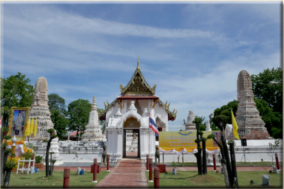
ภาพที่ ๑ วัดศาลาปูนวรวิหาร