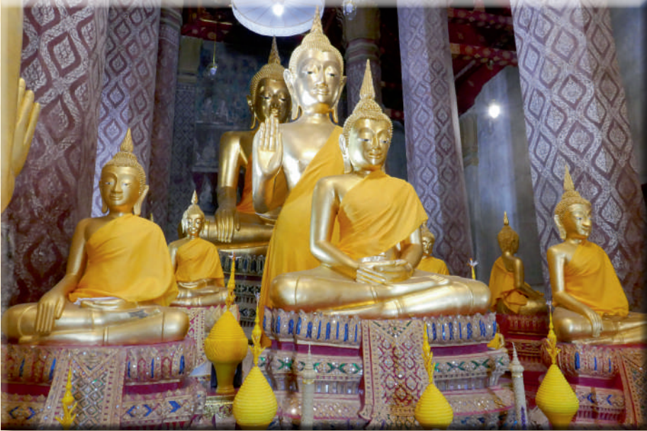
ภาพที่ ๙ พระพุทธปฏิมาประดิษฐานบนแท่นฐานชุกชีภายในพระอุโบสถ