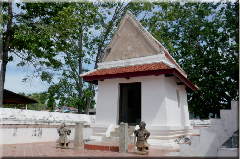
ภาพที่ ๒๐ มณฑปทรงคฤห์ประดิษฐานรอยพระพุทธบาท