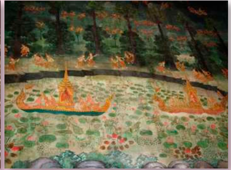
ภาพที่ ๓ ผนังทิศตะวันตก แนวต้นตาล กำแพงล้อมรอบสุทศสนนคร