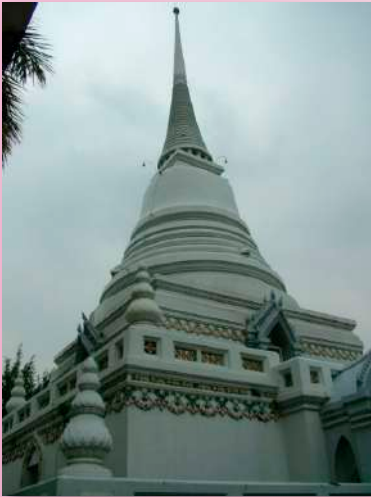
ภาพที่ ๑๑ พระสถูปทรงระฆัง ประดิษฐานพระบรมสารีริกธาตุ