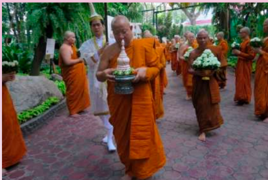
ภาพที่ ๒๙ พระเทพญาณวิศิษฎ์ เข็ญอัฐิหลวงปู่มั่น งาน ๑๔๙ ปีชาตกาลหลวงปู่มั่น ภูริทัตโต วัดปทุมวนาราม ๑๙-๒๐ มกราคม พ.ศ. ๒๕๖๒