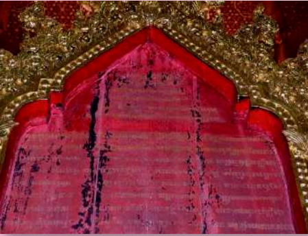
คาถาดำนานนพระสยาม พระราชนิพนธ์ในรัชกาลที่ ๔