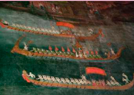
ภาพที่ ๑๕ เรือพระที่นั่งศรีสุนทรไช (ศรีสุนทรไชย) อัญเชิญผ้าพระกฐิน