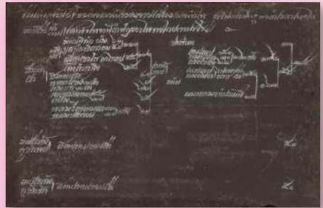
ภาพที่ ๒๐ หมายรับสั่งรัชกาลที่ ๔ (จศ. ๑๒๒๙) พระราชทานผ้าพระกฐินฯ เลขที่ ๑๓ มัดที่ ๓๓ (ต้นฉบับของกระทรวงมหาดไทย เอกสารหอสมุดแห่งชาติ)