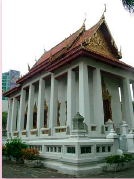
ภาพที่ ๑ พระอุโบสถวัดปฐมวณาราม