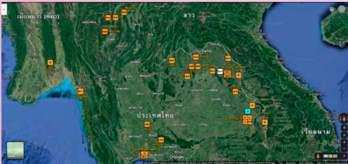
ภาพที่ ๒๘ แผนที่เส้นทางจาริกธรรมของหลวงปู่มั่น ตั้งแต่ พ.ศ. ๒๔๓๖ – พ.ศ. ๒๔๘๘ ปรับปรุงจากแผนที่รอยธรรม เส้นทางหลวงปู่มั่น วีรศักดิ์ จันทร์สังแสง. พระอาจารย์มั่น ภูริทัตโต อริยสงฆ์แห่งยุคสมัย, หน้า ๘๐-๘๑.