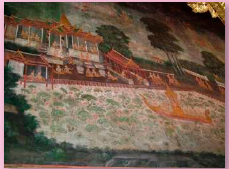
ภาพที่ ๘ ผนังด้านทิศเหนือ ห้องด้านใน : มิสั๊กวันอุทยานและมิสั๊กโบกขรณี