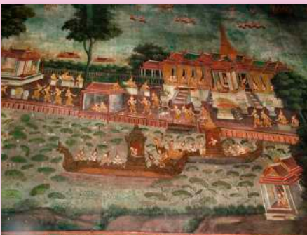
ภาพที่ ๙ ผนังด้านทิศเหนือ ห้องด้านนอก : นันทวันอุทยานและนันทาโบกขรณี