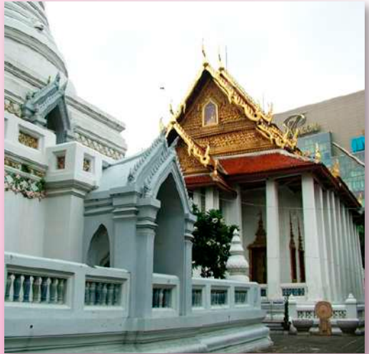
ภาพที่ ๑๒ พระวิหาร