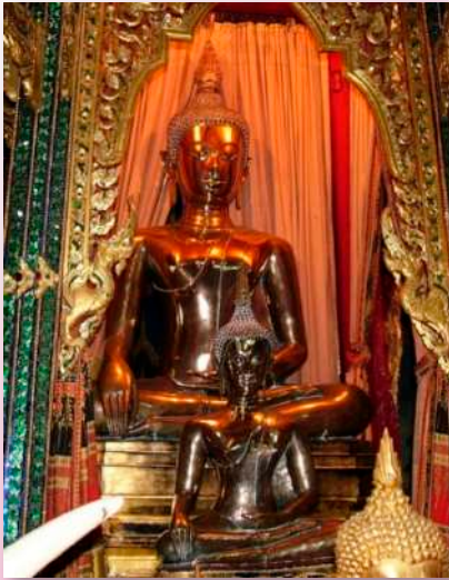
ภาพที่ ๑๔ พระเสริม