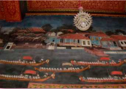
ภาพที่ ๑๓ กระบวนเรือพยุหยาตราและ พลับพลาทำน้าพระที่นั่งช้างคพิมาน