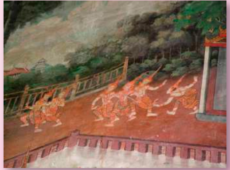
ภาพที่ ๖ ผนังด้านทิศใต้ ห้องด้านใน : เทพยดาที่เข้ามาในสวน มีจิตเข้มแข็งห้าวหาญ