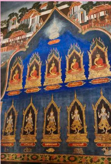
ภาพที่ ๑๓ ภาพจิตรกรรมที่เบื้องหลังพระเสริม แสดงถึงความสัมพันธ์ระหว่างคติพุทธศาสนา เถรวาทและพุทธศานาмаหายาน