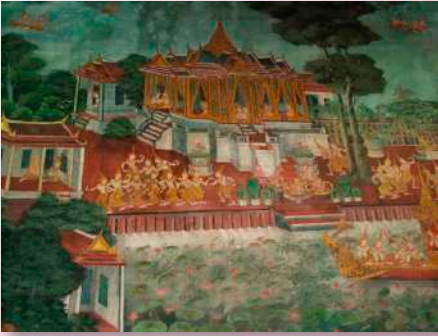
ภาพที่ ๕ ผนังด้านทิศใต้ ห้องด้านนอก : จิตรลดาวันอุทยานและจิตรลดาโบกขรณี