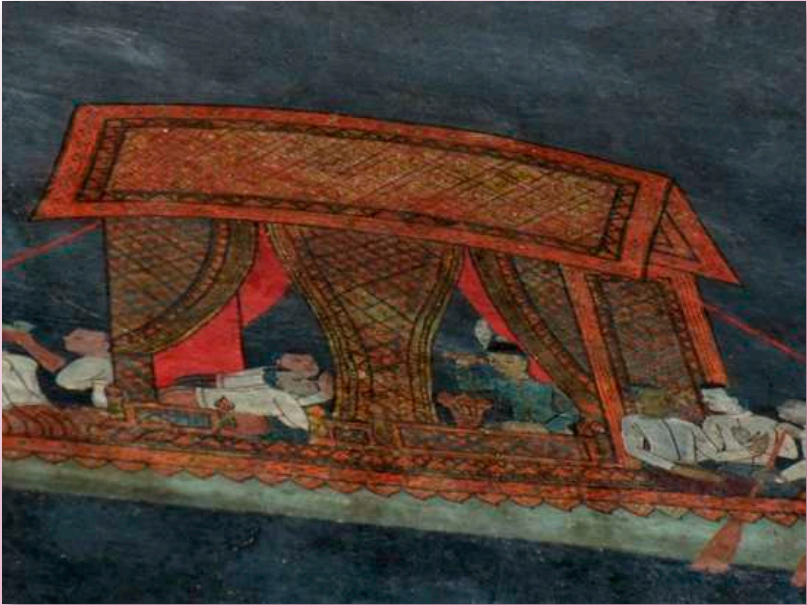
ภาพที่ ๒๒ พระบาทสมเด็จพระจอมเกล้าเจ้าอยู่หัว ทอดพระเนตรทัศนียภาพผ่านกลังโทรทรศรม์