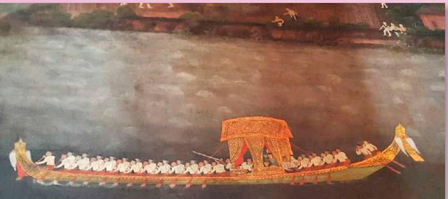
ภาพที่ ๒๑ พระบาทสมเด็จพระจอมเกล้าเจ้าอยู่หัว ประทับบนเรือพระที่นั่งรัตนดิลก