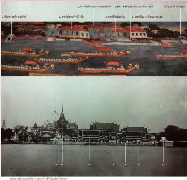
ภาพที่ ๑๖ พระบรมมหาราชวังในภาพจิตรกรรม ภาพเปรียบเทียบกับภาพถ่ายเก่า