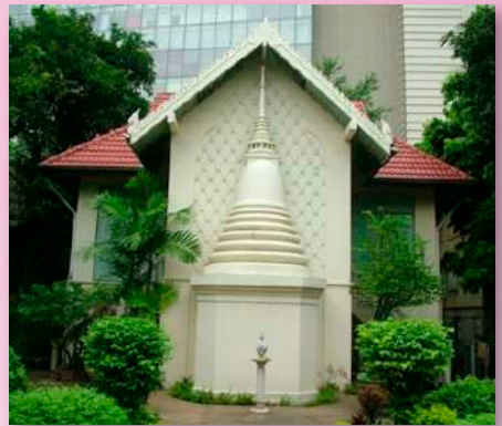
ภาพที่ ๒๔ โรงเรียนพระปริยัติธรรม