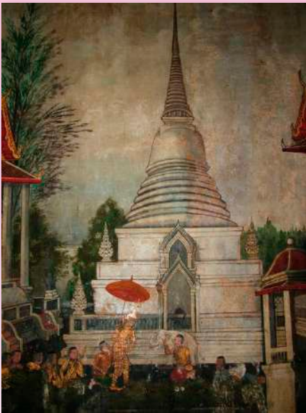
ภาพที่ ๒๓ ศรีธัญชัยตอนแข่งขันเขียนรูป ช้างเผือกงาดำ