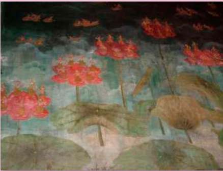
ภาพที่ ๗ ผนังทิศตะวันออก : สระโบกขรณี ในกิ่งงาช้างเอราวัณ