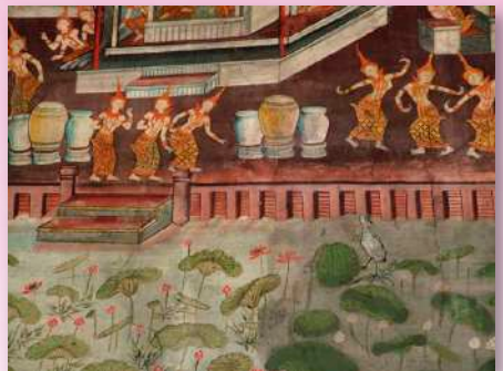
ภาพที่ ๑๐ นางสุธรรมา นางสุจิตราและนางสุนันทา กล่าววดีเตียนนางสุชาติา ที่เกิดเป็นนางนกยาง