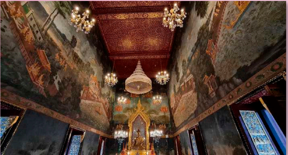
ภาพที่ ๔ ภาพจิตรกรรมผนังเหนือกรอบช่องหน้าต่าง ภาพพระและสวนบนสวรรค์ชั้นดาวดึงส์