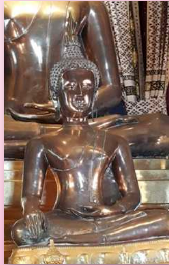
ภาพที่ ๑๕ พระแสน (เมืองมหาชัย)