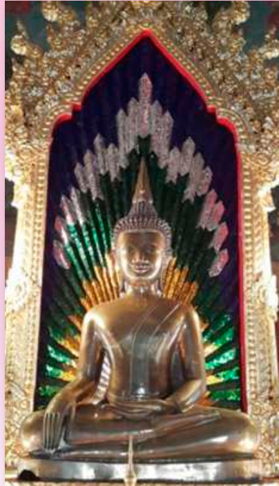
ภาพที่ ๒ พระสาयน์