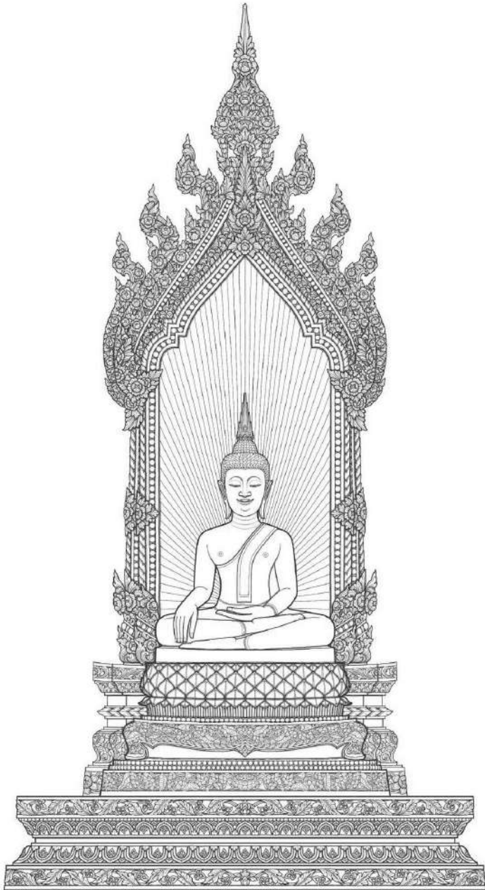
พระพุทธรูปนิรมิตพระศาสดา พระอุโบสถ วัดป่าทุมฉนวนราม กรุงเทพมหานคร วันจันทร์ที่ ๑๖ ตุลาคม พุทธศักราช ๒๕๑๖