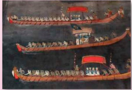
ภาพที่ ๑๔ เรือตั้งอัญเชิญธงพระจอมเกล้า ริ้วสายกลาง ขนมาข้างด้วยเรือดำรวจ