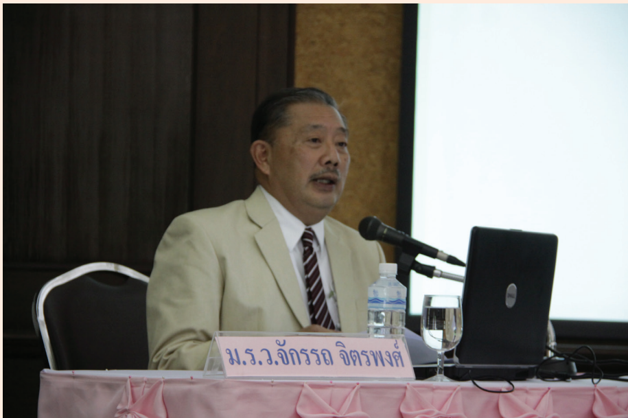
ปาฐกถาครั้งที่ ๖ วันศุกร์ที่ ๑ มิ.ย. ๒๕๕๕ เรื่อง "วีรกรรมของสมเด็จพระเจ้าบรมวงศ์เธอ กรมพระยาดำรงราชานุภาพ"