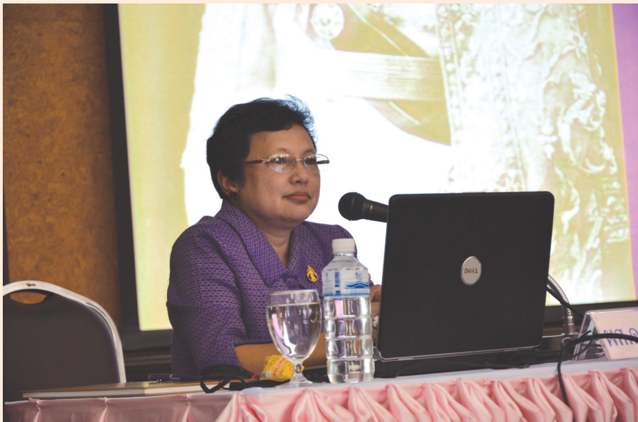
ปาฐกถาครั้งที่ ๘ วันศุกร์ที่ ๑๓ ก.ค. ๒๕๕๕ เรื่อง “สมเด็จพระกรมพระยาดำรงราชานุภาพ กับงานโบราณคดี”