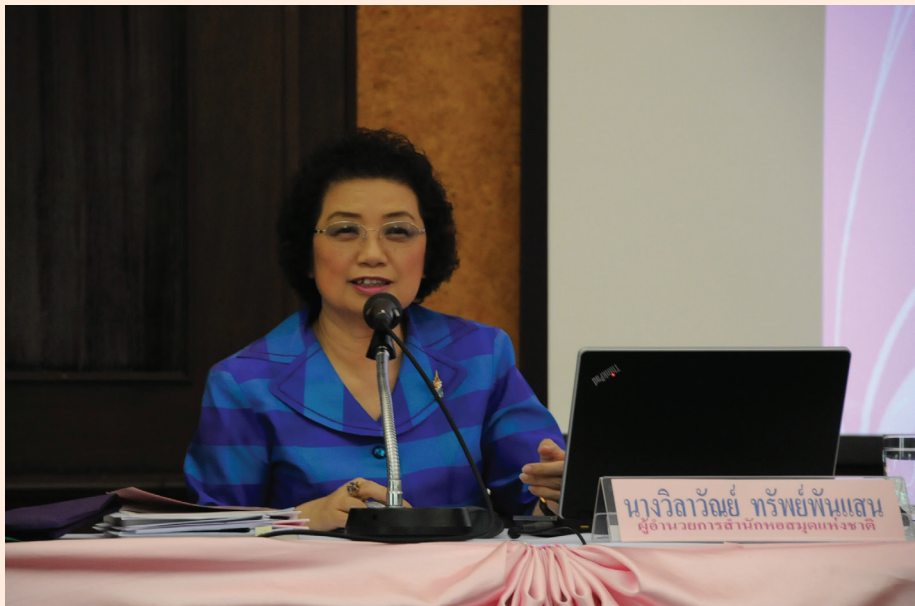
ปาฐกถาครั้งที่ ๓ วันศุกร์ที่ ๓๐ มี.ค. ๒๕๕๕ เรื่อง “สมเด็จพระยาตากษานุภาพ กับตำนานหอสมุดแห่งชาติ”