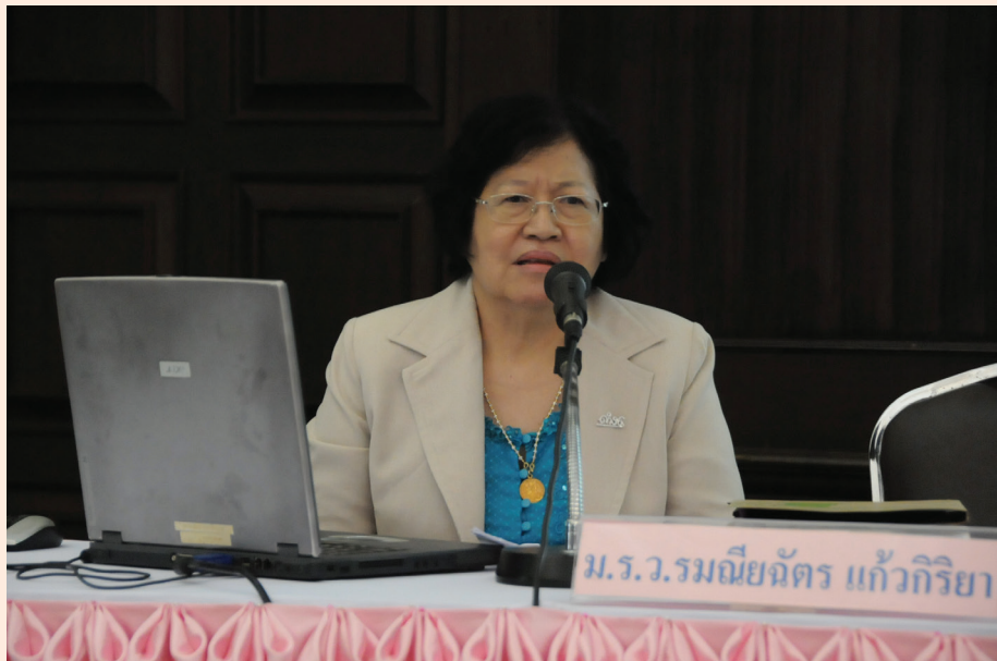
ปาฐกถาครั้งที่ ๔ วันศุกร์ที่ ๒๔ ส.ค. ๒๕๕๕ เรื่อง “ปู่ของฉันชื่อดำรงราชานุภาพ”