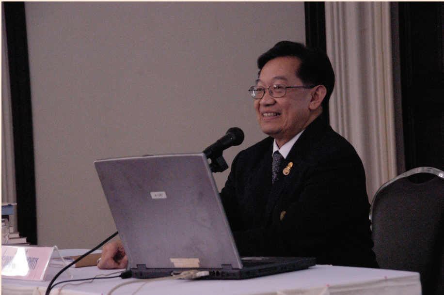
ปาฐกถาครั้งที่ ๒ วันศุกร์ที่ ๑๐ ก.พ. ๒๕๕๕ เรื่อง “สาส์นสมเด็จพระเจ้า”