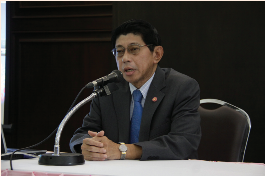
ปาฐกถาครั้งที่ ๗ วันศุกร์ที่ ๑๕ มิ.ย. ๒๕๕๕ เรื่อง “สมเด็จพระกรมพระยาดำรงราชานุภาพ กับการปกครอง”