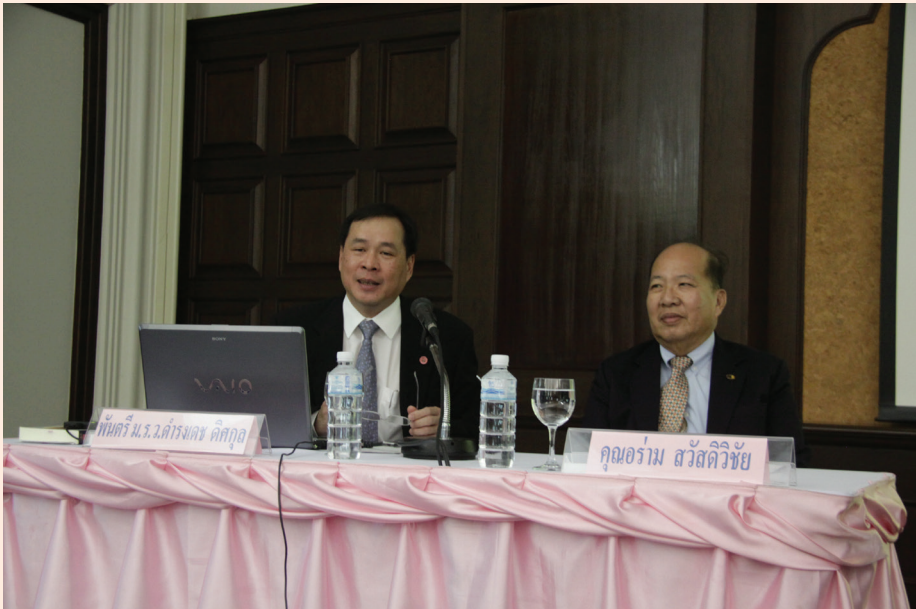
ปาฐกถาครั้งที่ ๔ วันศุกร์ที่ ๔ พ.ค. ๒๕๕๕ เรื่อง “เรื่องน่ารู้เกี่ยวกับสมเด็จพระยา ดำรงราชานุภาพ”