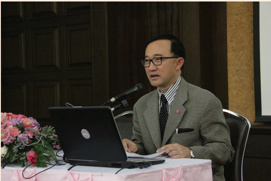
ปาฐกถาครั้งที่ ๑ วันศุกร์ที่ ๖ มกราคม ๒๕๕๕ เรื่อง “๑๕๐ ปีสมเด็จพระเจ้าบรมวงศ์เธอ กรมพระยาดำรงราชานุภาพ”