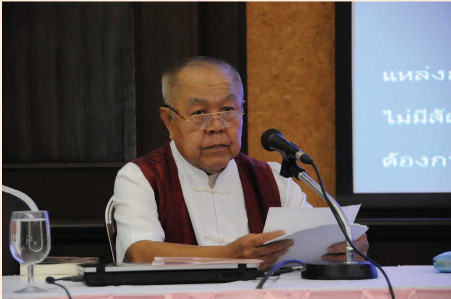
ปาฐกถาครั้งที่ ๕ วันศุกร์ที่ ๑๘ พ.ค. ๒๕๕๕ เรื่อง “สมเด็จพระยาดำรงราชานุภาพ กับคนร่วมสมัย”