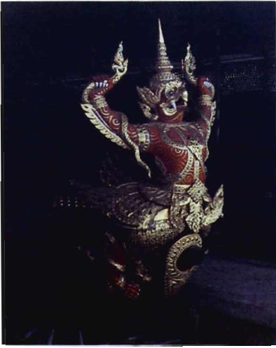
เรือครุฑเทินระเห็จ