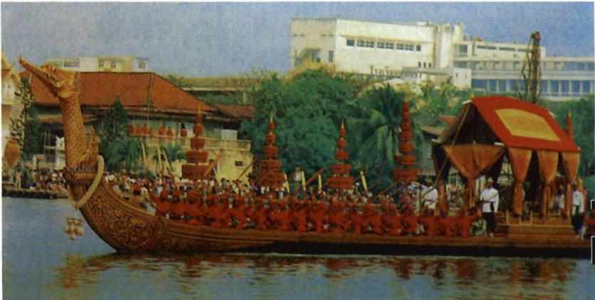
เรือพระที่นั่งสุพรรณหงส์