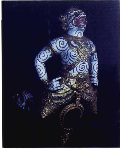
เรือกระบี่ปราบเมืองมาร