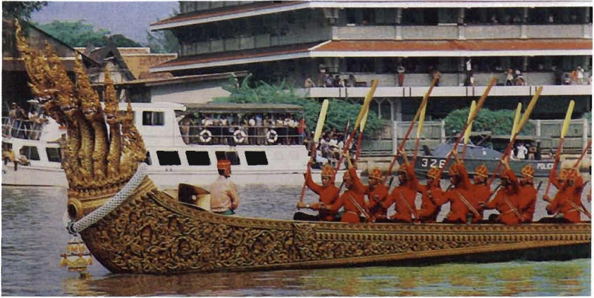
เรือพระที่นั่งอนันตนาคราช