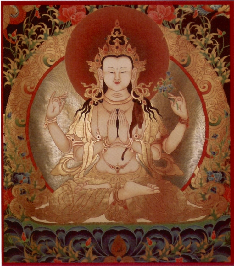
พระอวโลกิเตศวรสีพระกร

กล่าวโดยสรุป การที่จะได้เกิดเป็นมนุษย์นั้น ตามพระบาลีว่า “กิจโฉ มนุสส ปฐิลาโก กิจฉ มจจาน ชีวิต” การมีชีวิตอยู่ก็เป็นไปได้ยากของสิ่งที่จะต้องตาย “มจจาน” เป็นสิ่งที่ต้องตาย “กิจฉ สทมมสสวน” การที่จะได้ยินพระสัทธรรมของพระพุทธเจ้า ก็เป็นไปได้ยาก “กิจโฉ พุทธานมฺบุปโท” การที่จะเกิดขึ้นของพระพุทธเจ้าก็ยาก เพราะฉะนั้น “ทุลลโก ปุริสาชโยญ” ผู้ที่เกิดมาแล้วรู้เหตุรู้ผลสมบุรณ์ อยู่ในโลกนี้ อย่างสมดุลกัฬายาก “ทุลลโก” คือไม่ได้ง่าย ๆ “น โส สพฺพตฺต ชยติ” ไม่ใช่เกิดในทุกที่