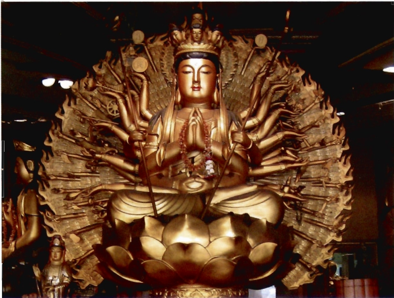
พระอวโลกิเตศวรพันเนตรพันกร

ช่วยคนทั้งหลายสารพัด เพราะฉะนั้นรูปเคารพที่เป็นปางพันกรพันเนตร ก็คือไว้ส่องตรวจดูความทุกข์ของสัตว์โลก เช่นเดียวกับเรดาร์ และเป็นเรดาร์ที่ละเอียดมาก เพราะฉะนั้นใครๆ จึงพากันนับถือพระอวโลกิเตศวร เมื่อผ่านไปๆ หนักเข้า ปณิธานที่ว่าจะนำพาสัตว์ไปสู่นิพพานนั้นกลับได้รับความนิยมนหรือสำคัญขึ้นมาจนกระทั่งกลายเป็นว่ากลบสว่นปรัชญาไปเลยทีเดียว เพราะว่าผู้คนนับถืออวโลกิเตศวร เพราะเห็นว่ายากกว่า อ้อนวอนขอให้พระอวโลกิเตศวรช่วยก็ย่อมจะง่ายกว่าต้องเพียรปฏิบัติตั้งเริ่มต้นรักษาศีล ให้ทาน ต้องมานะอดทน ต้องเผาผลาญกิเลส ต้องมีวิริยะอย่างแรงกล้า จึงจะไปถึงปรัชญา บุษบาพระอวโลกิเตศวรร่างกายว่า คือเพ่งดูท่านไป เกิดความกรุณาขึ้นในหัวใจ จนหลุดออกจากความเป็นตัวเป็นตน