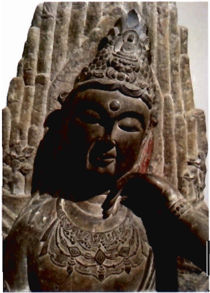
พระอวโลกิตศวร