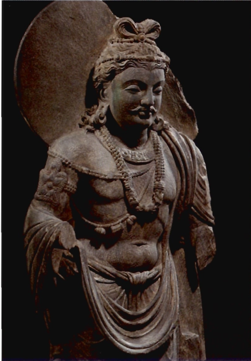
พระเมตไตรย

ก็เป็น “ไมเตรย” เพราะฉะนั้นพระนามของพระพุทธเจ้าพระองค์นี้ก็คือบุคลาธิษฐาน ของความเป็นมิตร ความเป็นเพื่อนกันไปด้วยกันนั่นเอง