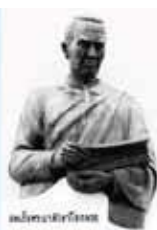
สมเด็จพระพุทธเลิศหล้านภาลัย