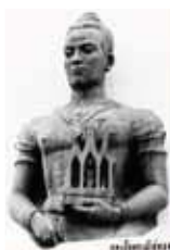
สมเด็จพระปฐมบรมมหาชนก