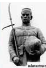
สมเด็จพระนั่งเกล้าเจ้าอยู่หัว