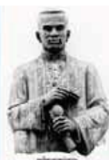
สมเด็จพระจอมเกล้าเจ้าอยู่หัว