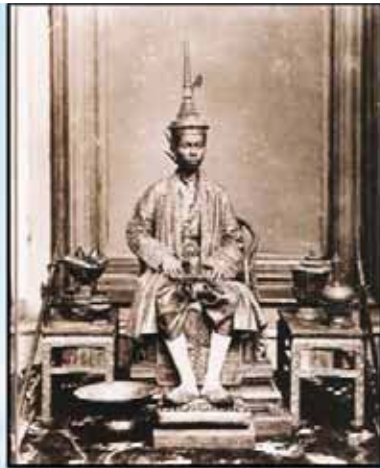
“อเนกนิกรสโมสรสมมติ”

พระสงฆ์ พระราชวงศ์ ขุนนาง และประชาชน เห็นห้องโถงเสด็จขึ้นครองราชย์